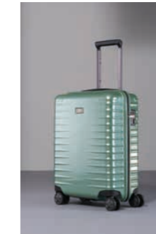
80 Traubengrün (Flash)