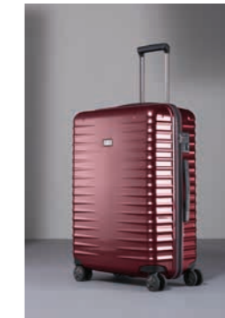
10 Kirschtrot (Flash)