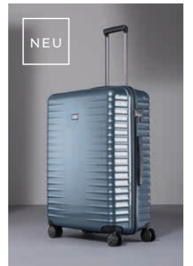
25 Eisblau (Flash)