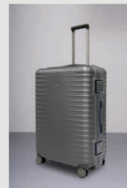
01 Schwarz (Matt)

Extrem formstabil und wartungsfrei – der Polycarbonat-Rahmen überzeugt auf ganzer Linie. Er verfügt über eine innenliegende Kreuzverrippung. Dadurch erhält der Rahmen seine Stabilität. Um diesen Effekt zusätzlich zu unterstützen, erhält die Schale um die Ecken herum einen angepassten Zuschnitt. Dies erhöht die Stabilität im Eckbereich und verhindert ein ungewolltes Öffnen des Rahmens an den kritischen Stellen.