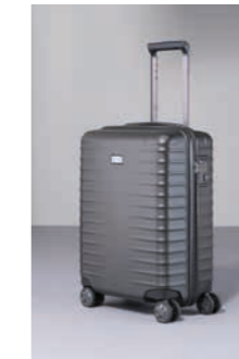
01 Schwarz (Matt)