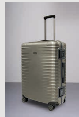
40 Champagner (Matt)