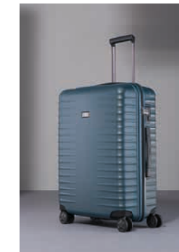
22 Petrol (Matt)