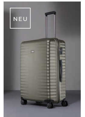
40 Champagner (Matt)

Außergewöhnliches Design schafft Aufmerksamkeit. Premiumqualität sorgt für Langlebigkeit. Der LITRON ist mehr als ein hochwertiger Koffer mit einem überzeugenden Platzangebot und durchdachten Details, wie z.B. die besonders geräuscharmen Doppelrollen.